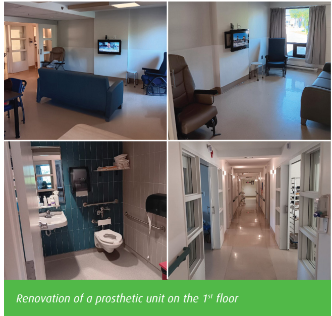
Renovation of a prosthetic unit on the 1 st floor

The Saint Brigid's Home CHSLD has 142 private rooms. It is the only public long-term care facility in the Capitale-Nationale region that offers care and services in both English and French.