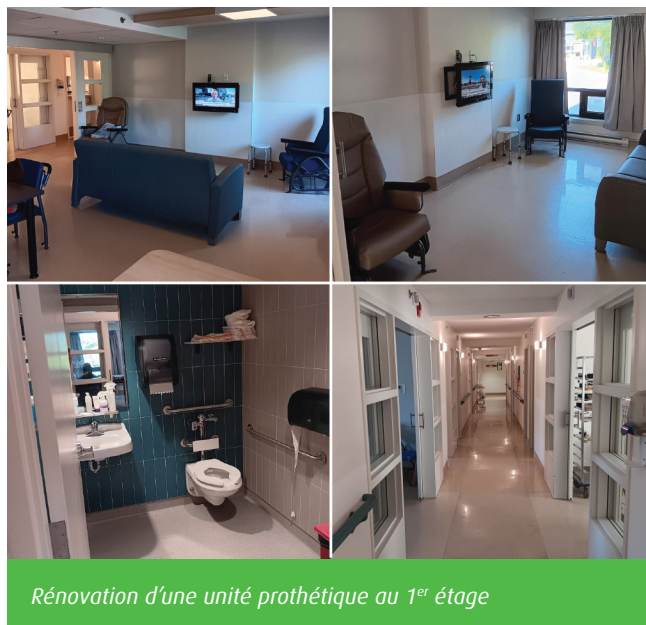
Rénovation d'une unité prothétique au 1 er étage

Le CHSLD Saint Brigid's Home, compte 142 lits en chambre privées. Il est l'unique centre d'hébergement